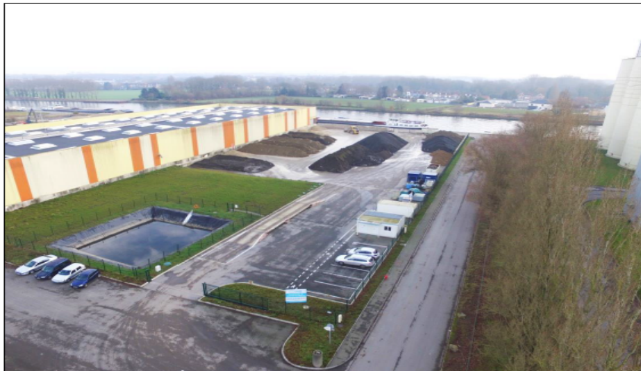
Illustration n° 6 : Vue du site depuis la 3 eme rue

localisation du projet